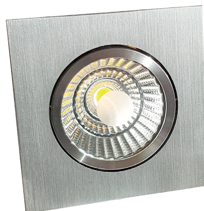
L 53903-S/F mit Metalloberfläche