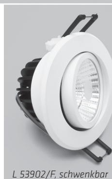
L 53902/F, schwenkbar