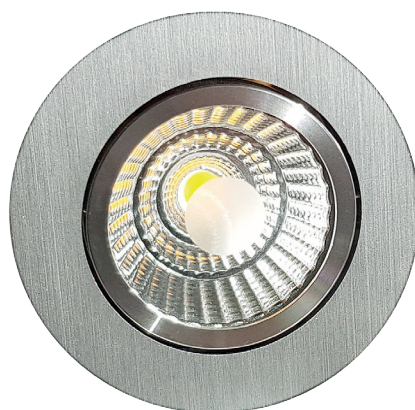
L 53902-S/F mit Metalloberfläche