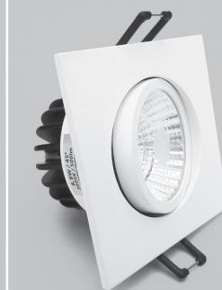
L 53903/F, schwenkbar