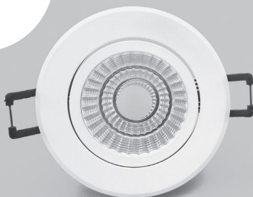
L 53902/F in weiß